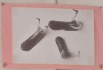
Игра утиными носами

У каждой хантыйской семьи было несколько игрушек: весенняя, летняя, зимняя, осенняя. Переезжая к местам промысла, ханты вынуждены были на длительный срок оставлять свои постройки. Для того чтобы лесные звери не разворошили стойбище, приходилось вытравить игрушки и лабазы. Но заводских замков в те времена не было, поэтому мужчины придумывали свои приспособления. Позже макеты таких замков стали делать специально для развлечения и называть «мумасты кинтусеты» - «для думания игрушки».