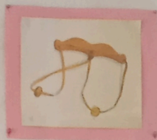
Игра-головоломка «Стоимостью пяти лошадей палочка»

Играли в нее в любое время года девочки на столе в чуме. В игре участвовали обычно два-три человека. Для игры дети изготавливали из обрезанных утиных ног и разветвленной грушевой косточки диков тусей, уток, игрушки, которые изображали оленей. Если в дырочки утиного носа втыкали грушевую косточку утки, то это был «олень», вывеска, а «выком» считалась за игрушка, в нос которой вставляли большую по размеру грушевую косточку тусей. Дети привязывали к «оленю» шары, которые изготавливали из сплетенных коровьих или козлячьих косточек, и передвигали их по столу, изображая караван (анис), «перекочевывающий» на другое место. Игра способствовала овладению знаниями и навыками промысловой и хозяйственной деятельности, развитию воображения, наблюдательности.