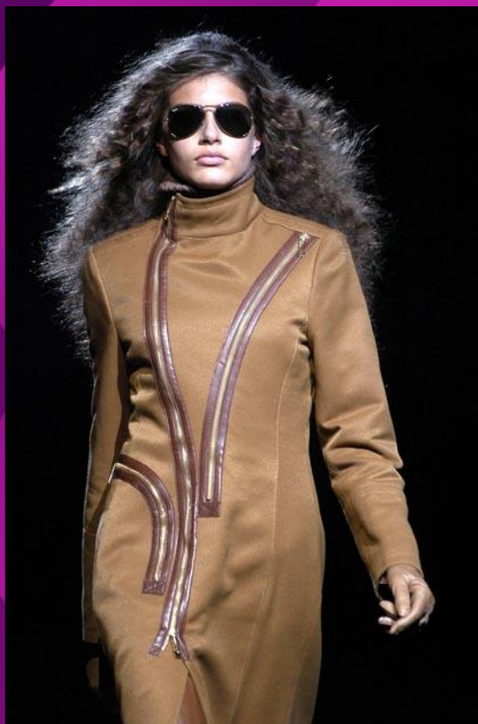
Застёжки – «молния»